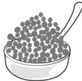
¡¡ DISFRUTA !!

* Dentro de este estuche te damos 4 sobres de ZUKO® de diferentes sabores, pero recuerda que tu también puedes hacer tu propio jugo totalmente natural. Pide a un adulto que te ayude.