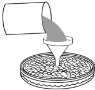
1. vacía el jugo dentro del molde